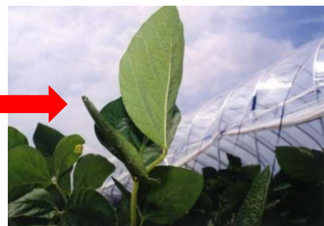
図 かん水のめやす(直立した小葉)