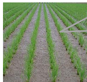
中干し適期は条間が、 葉で重なり合う前