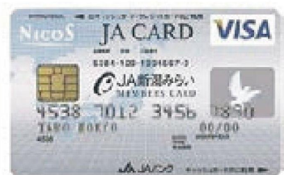
③JAカード (クレジット・キャッシュカード一体型)